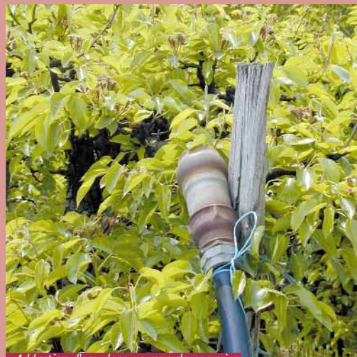
Adduction d'eau dans un rang de pommier

On peut raisonner la conduite du verger, en ajustant les besoins réels en eau des plantes avec, par exemple, l'utilisation d'un goutte-à-goutte.