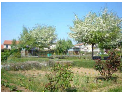
Jardin de Rillieux la Pape