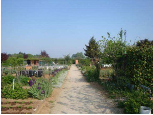
Jardins de Décines