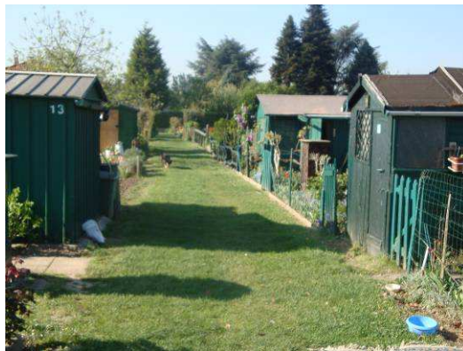
Vue satellite des jardins de Sainte Foy