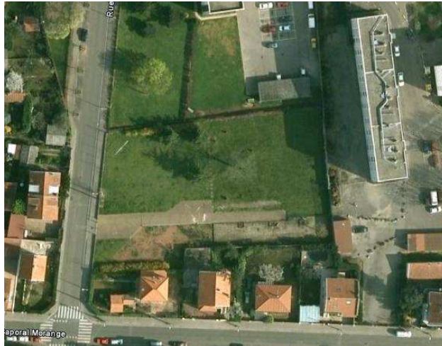
Les jardins de Villeurbanne