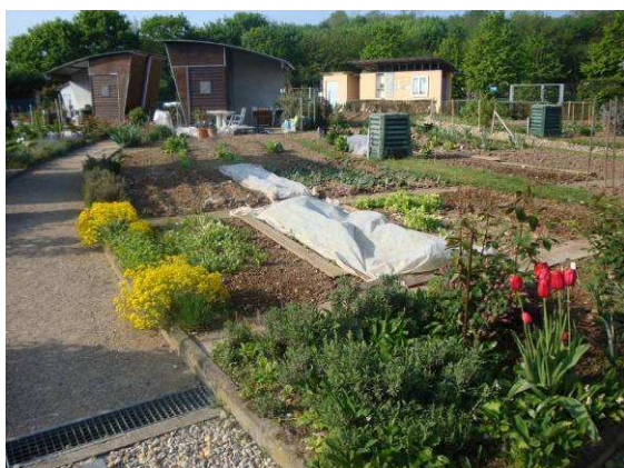
Jardin du fort de Bron