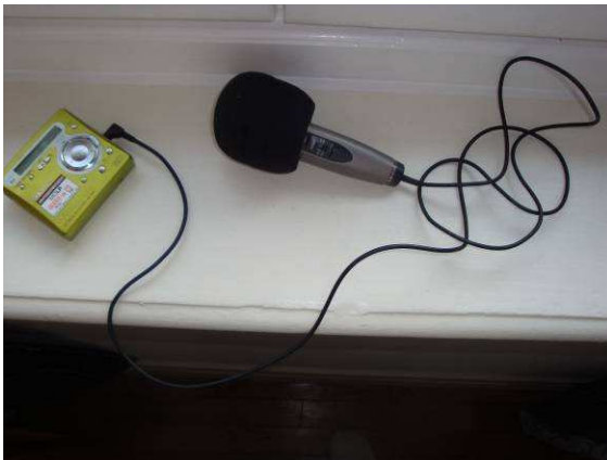
Enregistreur et microphone

La méthode IPA a été appliquée dans les jardins en définissant une ou plusieurs stations d'observations selon la surface étudiée. Elle permet de recenser les oiseaux sans les déranger. Les stations d'observations sont souvent situées proche d'un bois, d'un grand arbre ou d'une haie à l'abri des regards. Il faut ensuite rester immobile entre 15 et 20 minutes, enregistrer et noter toutes les espèces vues en vol, posées ou entendues. Les chants et les cris sont enregistrés à l'aide d'une parabole, d'un microphone et d'un enregistreur, afin de les comparer à des chants « témoins » pré enregistrés sur un compact disc pour les identifier.