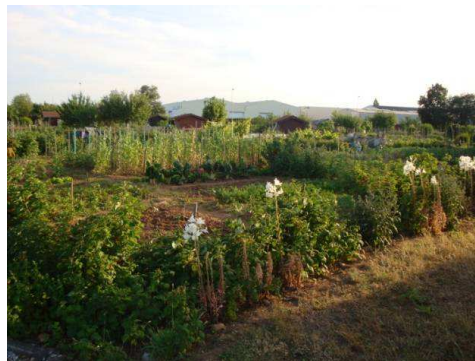
Les jardins de Chassieu

3 stations d'écoute ont été privilégiées dans cette zone : deux stations aux extrémités du demi cercle où les grands arbres sont plus présents et une station à proximité de la route départementale.